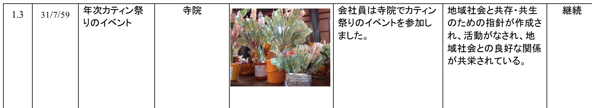
表 1 会社の広報活動計画「広報と社会貢献（CSR）」