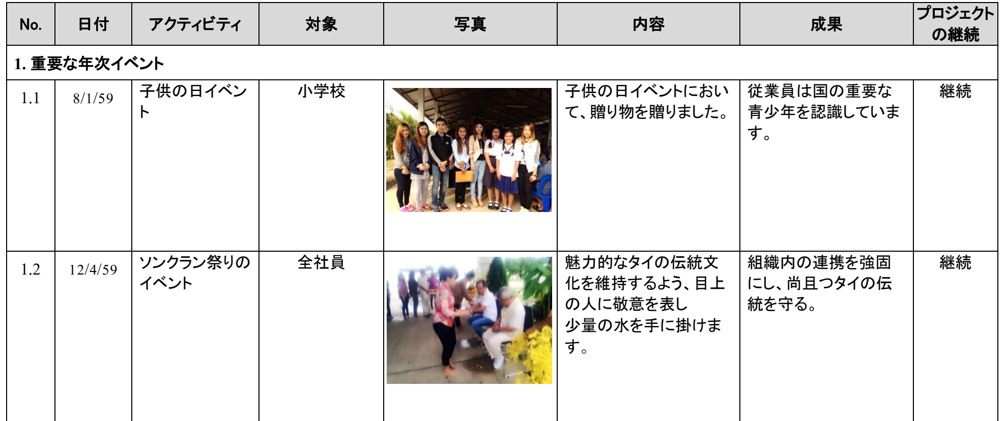
表1 会社の広報活動計画「広報と社会貢献（CSR）」